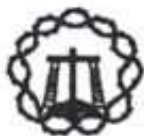
Horarios de interés